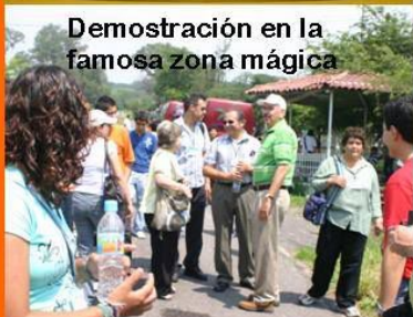
Demostración en la famosa zona mágica