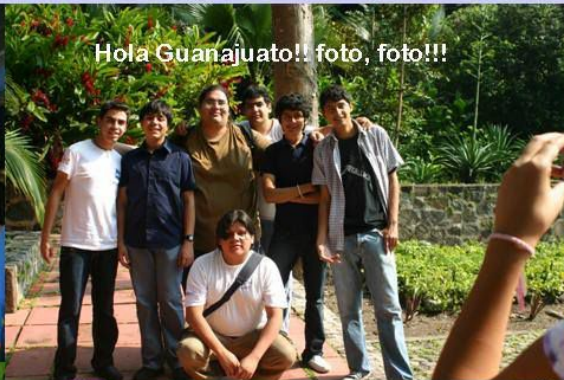
Hola Guanajuato!! foto, foto!!!