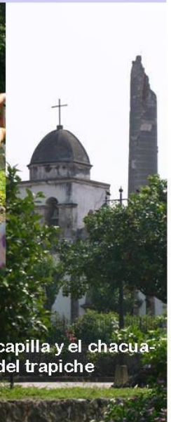
La capilla y el chacuaco del trapiche