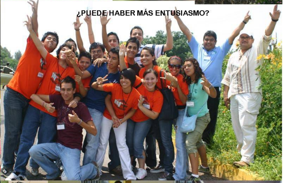
¿PUEDE HABER MÁS ENTUSIASMO?