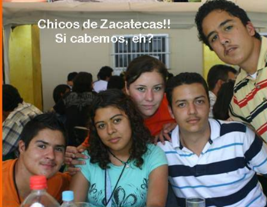
Chicos de Zacatecas!! Si cabemos, eh?