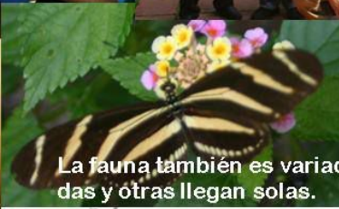
La fauna también es variada, unas son invitadas y otras llegan solas.