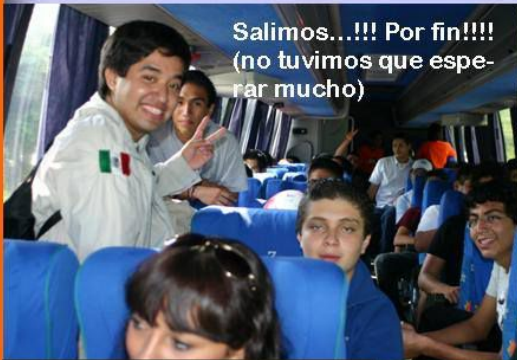
Salimos...!!! Por fin!!!! (no tuvimos que esperar mucho)